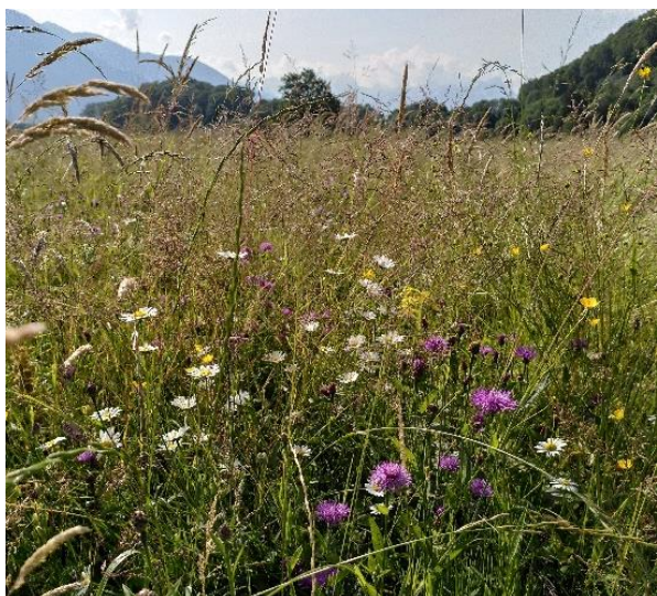
Vue d'une prairie dont la qualité écologique a été améliorée par sursemis avec des graines régionales dans le cadre du réseau.