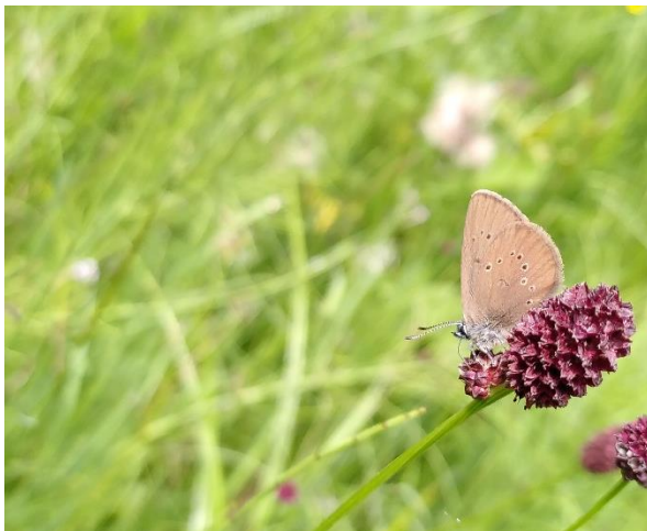
Azuré des paluds ( Phengaris nausithous ), espèces en danger d'extinction (EN), liée aux prairies humides.