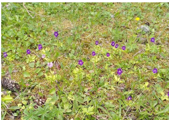
Grassette à grande fleur ( Pinguicula grandiflora )