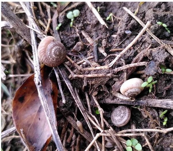
Trois individus d'hélicette des steppes, Arnex-sur-Orbe, octobre 2023.