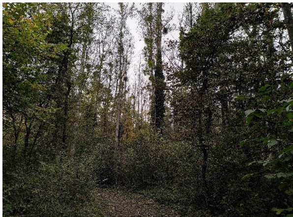
Frênaie plantée de peuplier, commune de Salavaux.