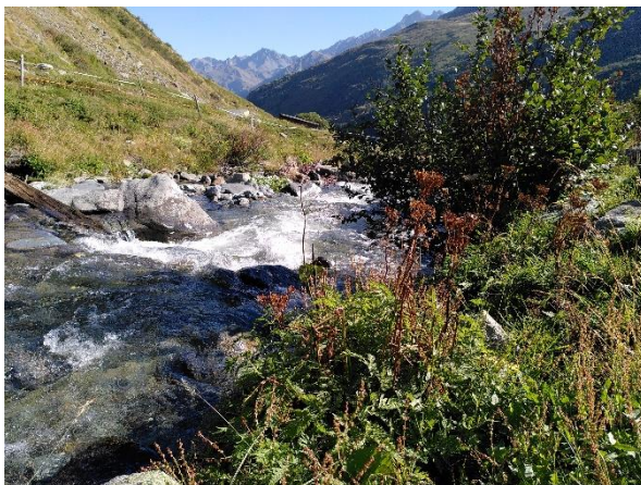
Le chérophylle élégant ( Chaerophyllum elegans ) au bord de la Dranse d'Entremont.